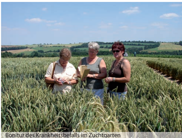
Bonitur des Krankheitsbefalls im Zuchtgarten