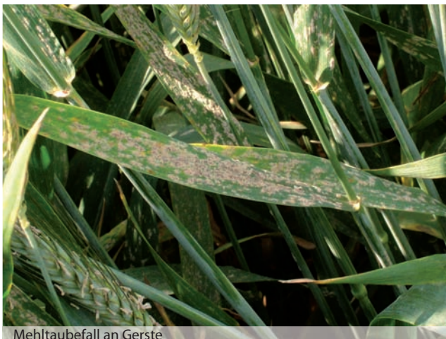
Mehltaubefall an Gerste