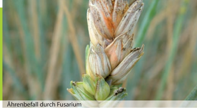
Ährenbefall durch Fusarium