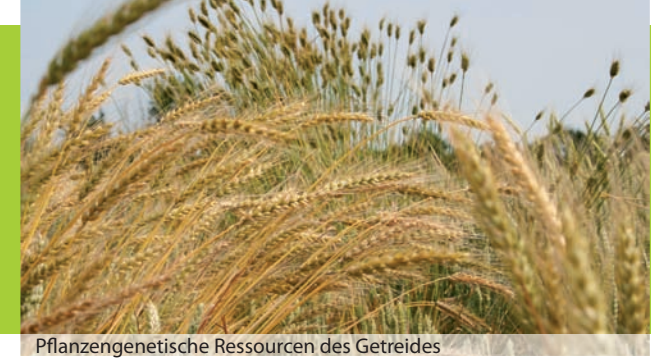
Pflanzengenetische Ressourcen des Getreides

Pflanzengenetische Ressourcen von landwirtschaftlich genutzten Kulturpflanzen sind ein Schatz der Menschheit. Viele Muster lagern in Genbanken, ohne dass ihr Wert bekannt ist. Seit Beginn der Pflanzenzüchtung werden aus dieser Vielfalt Pflanzen ausgelesen und durch Kreuzung gewünschte Eigenschaften kombiniert. Hieraus entstehen verbesserte Sorten für verschiedene Verwendungszwecke, als Nahrungs-, Futtermittel und nachwachsender Rohstoff sowie Biomasselieferant. Die Nutzung moderner Selektionsmethoden macht pflanzengenetische Ressourcen für die praktische Pflanzenzüchtung zunehmend interessanter.