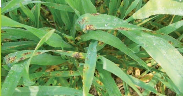
Netzflecken an Gerste