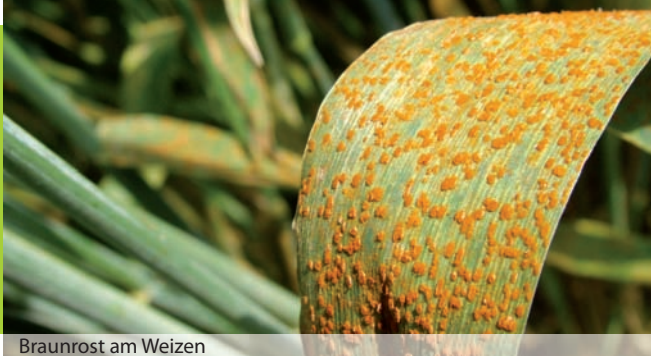
Braunrost am Weizen