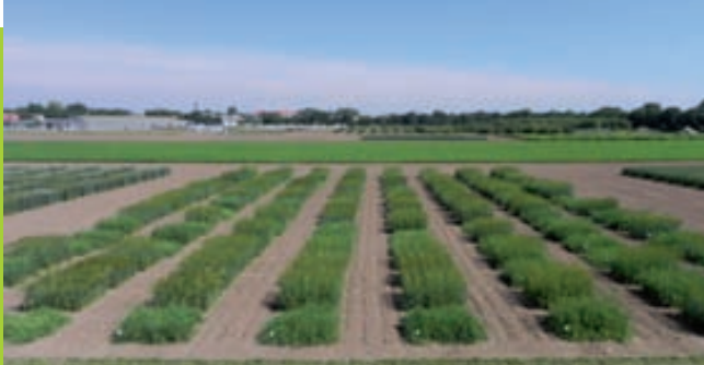
Vermehrungsparzellen für EVA II